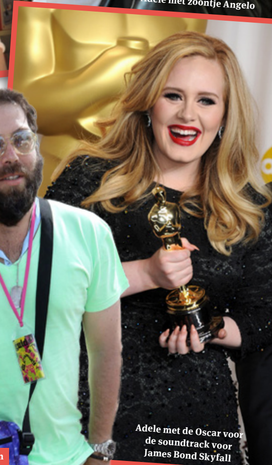
Adele met de Oscar voor de soundtrack voor James Bond Skyfall