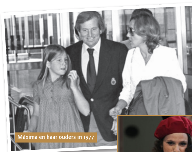
Máxima en haar ouders in 1977